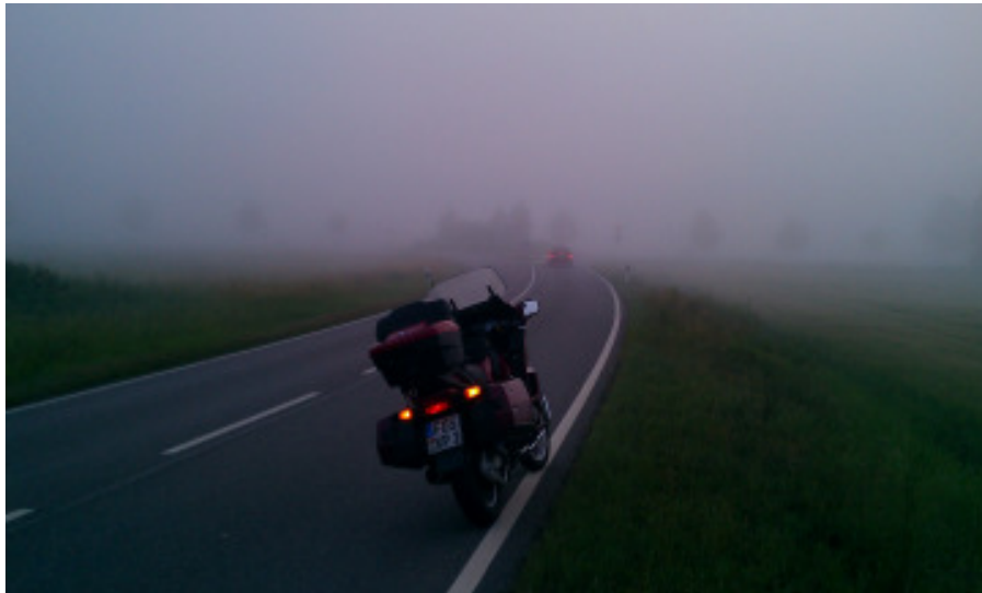
Begegnung am Straßenrand: Gültstein im Nebel.

Emsig versucht die Sonne die Umrisse des kleinen Dörfchens aus dem Nebel zu zimmern, in das ich gerade reinfahre. Sie wird noch eine Weile brauchen und das ist gut so. Der Nebel zeichnet die harten Konturen der „rauen Wirklichkeit“ weich. Alles schwimmt ein wenig und nur der Motor und die wie fest getackerten Nadeln von Tacho und Drehzahlmesser zeigen die Bewegung an.