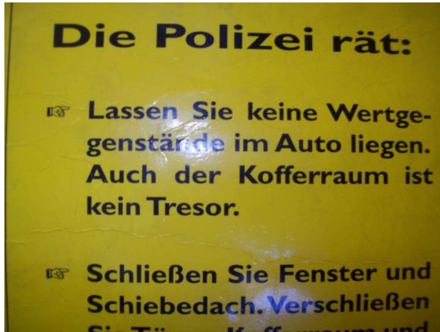
Polizei - Werbung aus den frühen Neunzigern

Beschilderung, die die Franzosen anbringen. Ich verlasse mich auf meine alte Straßenkarte aus Mairs geographischem Verlag, die die Baden-Württembergische Polizei Anfang der 90er Jahre als Werbegeschenk verteilt hat. „Wir wollen, dass Sie sicher leben“ so der Werbeslogan, der eine Seite ziert und Autofahrer auffordert, keine Wertgegenstände im Auto zu lassen, Felgen und Dachgepäckträger abzuschließen und Anderes mehr.