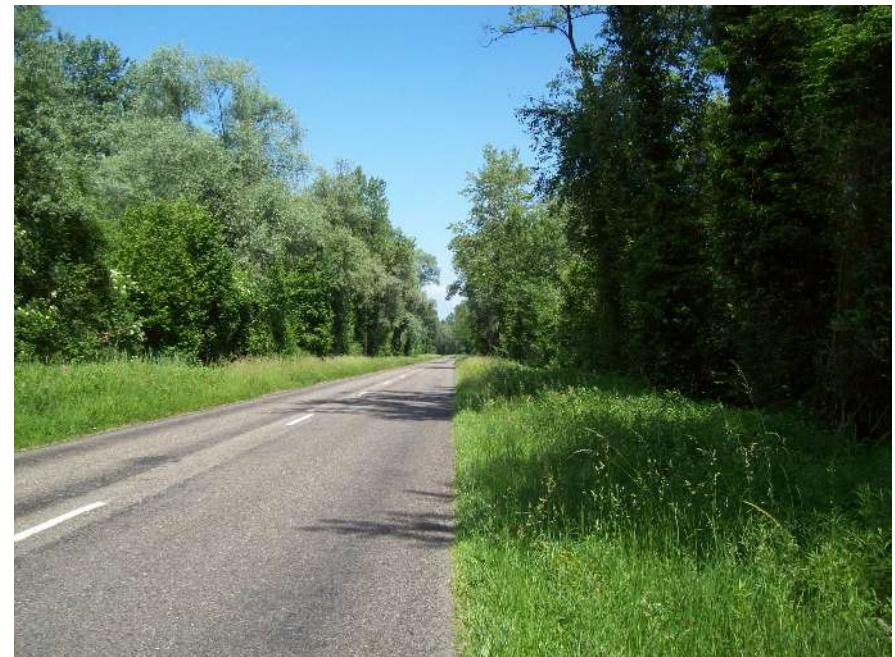
Durch die Rheinauen: Herrlich zum Cruisen.

Die Jacke ist trocken, aber jetzt dermaßen heiß, dass ich sie zu ihrem Futter in den Koffer packe.