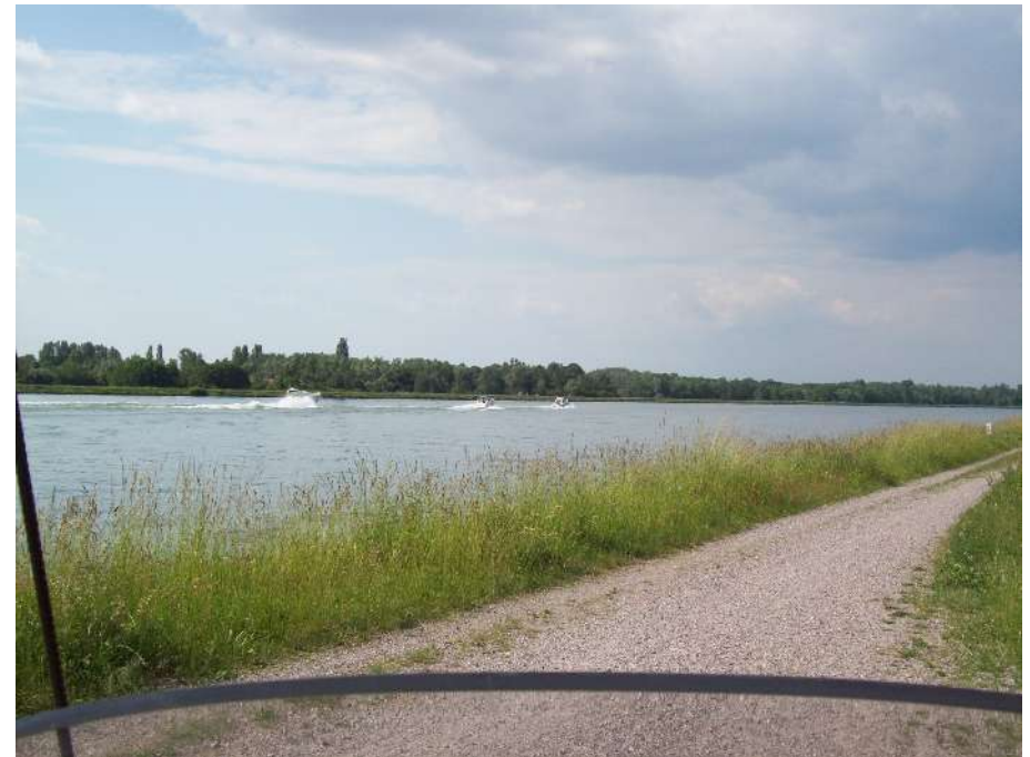
Motorboote auf dem Rhein bei Rheinau

Vom Ehrgeiz angenagt, suche ich die Straße am Rheinufer entlang, auch wenn man vom Strom, der erhöht hinter dem Damm fließt nichts sieht. Deshalb drehe ich in Auenheim auch nochmals um und folge dem Navi – wenngleich zweifelnd- in ein Industriegebiet und – habe Glück. Bis Rheinau heißt es erneut: Cruisen auf schnurgerader Straße und den Auenwald genießen. Zweimal mache ich einen (verbotenen) Abstecher auf den Rheindamm und beobachte ein wenig neidisch drei große Motorboote, die in schneller Verdrängerfahrt zu Tal fahren.