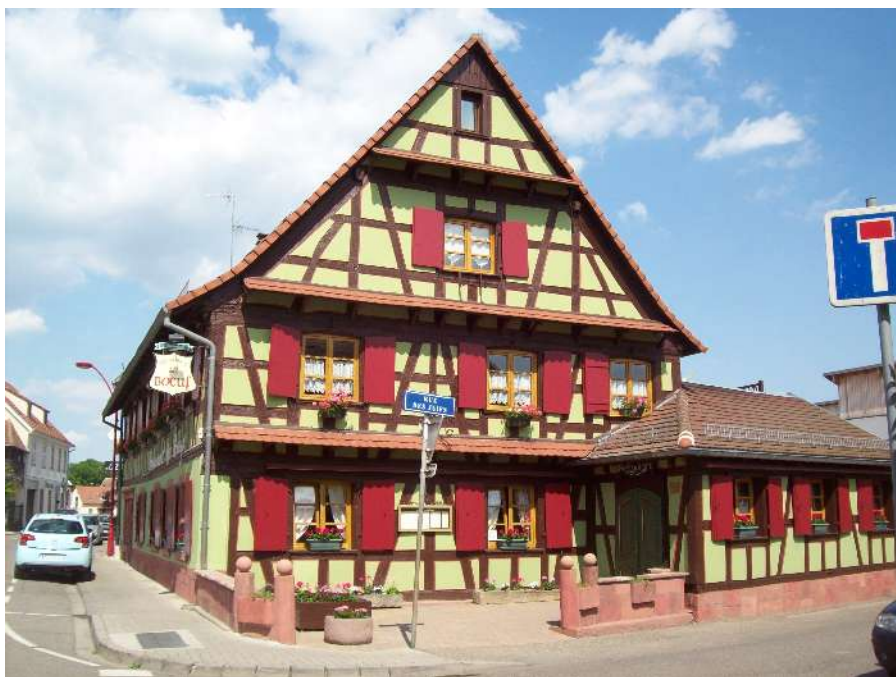
Restaurant „du Boeuf“ der „Ochsen“ in Plobsheim

Ich fahre zunächst mal auf gut Glück das schmale Sträßchen vom Parkplatz aus weiter und es entpuppt sich als die gelbe Linie auf meiner Karte. Im T-Shirt cruise ich gemütlich mit der BMW auf schnurgerader Strecke den Rheindamm entlang. Auenwälder wechseln mit Wildwiesen, es duftet nach Kräutern und den überall stehenden Wasserläufen, die Sonne blinzelt durch das Blätterdach und es ist angenehm warm. Fast mutterseelenalleine bin ich unterwegs und erforsche nebenher ein paar Abzweigungen, um ein schönes lauschiges Plätzchen für die Rast bei der Tour zu entdecken.